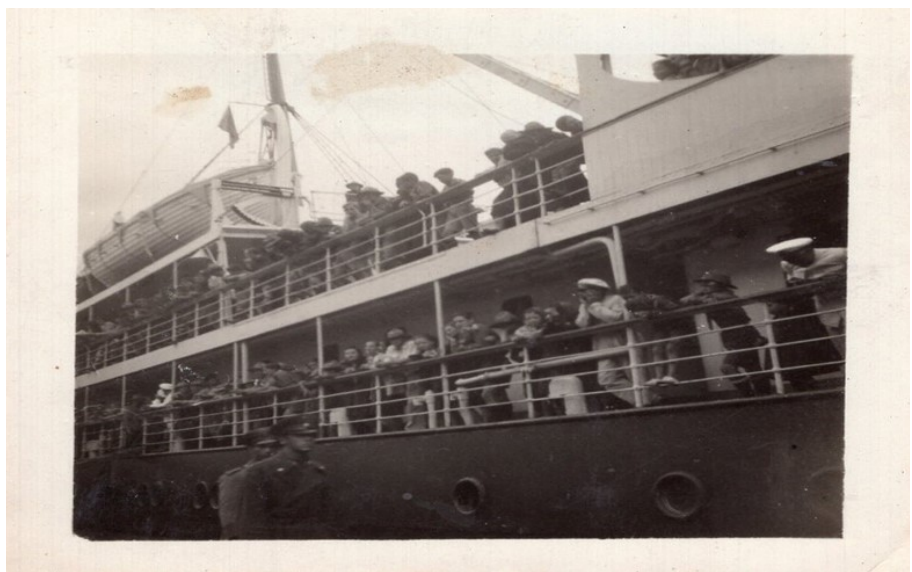
Figura 2- o navio Pará atracado no porto de Paranaguá no retorno dos escoteiros em 1939