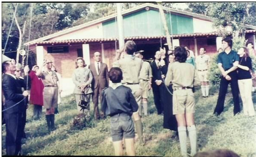
Figura 4- Hasteamento das Bandeiras com auxílio de escoteiros e lobinhos do Grupo Escoteiro Marechal Rondon

Também esteve presente um grande efetivo do Grupo Escoteiro Marechal Rondon que realizava o seu primeiro acampamento anual de grupo: o I Caicá-Herê.