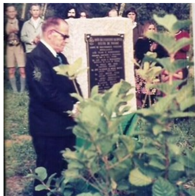
Figura 6- Descerramento da placa externa