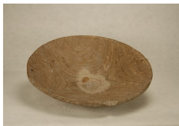
Figura 2- Antiga bateia de madeira - Museu das Bandeiras - Goiás

ão do Paraná foi a localidade de Bateias, no município de Campo Largo, distante aproximadamente 27 km (em linha reta) de Curitiba. O nome da localidade advém dos instrumentos usados na mineração de ouro e sofreu, durante os anos, variações na grafia: BATHEAS, BATEAS, BATEIAS.